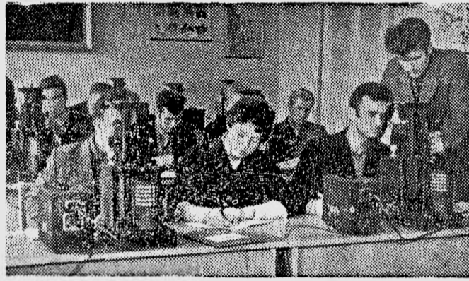
Студенты группы 213-1 механического факультета на лабораторных занятиях по металловедению.

В. ЛАВРИНЕНКО, секретарь парторганизации института.